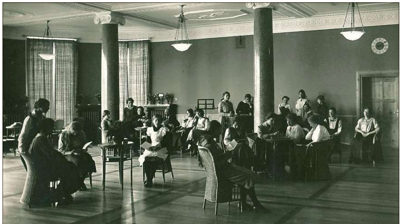
Las scolaras dal «Hochalpines Töchterinstitut Ftan» passaintan lur temp liber in l'aula.

Fingià da prüma davent frequentaivan blers uffants lur temp da scoula a Ftan.