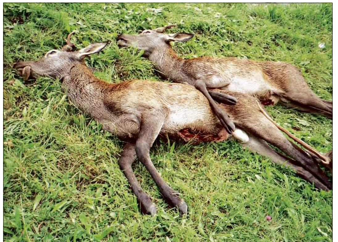
La selvaschina sittada stuess vegnir transportada aschi spert sco pusseivel en in local per sferdentar.