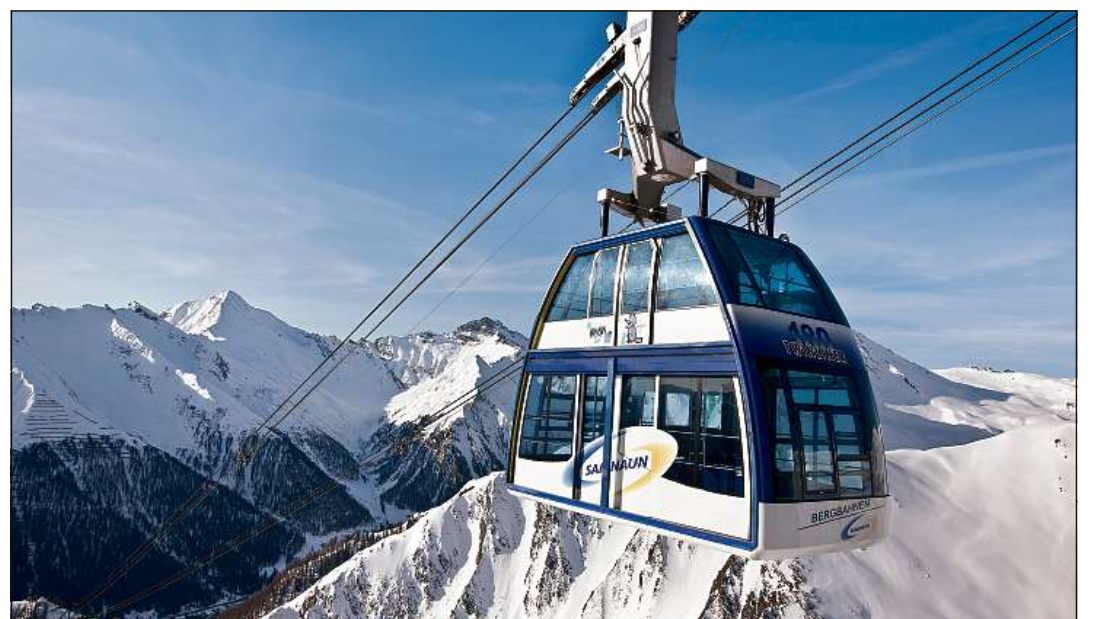
I'l focus es d'inviern in Samignun impustüt süen sias sportas per sport alpin.