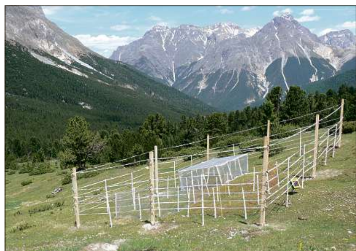
Per l'experiment sun gnüdas installadas differentas saivs i'l Parc Naziunal Svizzer.