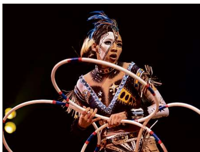
Gia passa tschintg milliuns aspectaturs ha la produziun actuala da Cirque du Soleil «Totem» captivà.

da premiera cun in u l'auter prominent – in di che pretenda ina massa da la dunna da 34 onns.