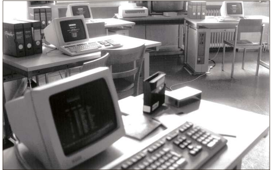
Ils prüms computers a l'IOF.