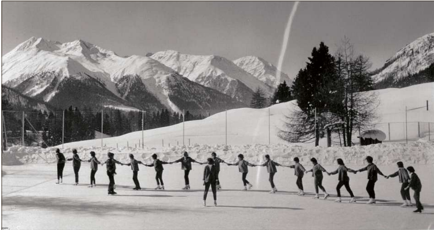
Fingià a seis temp d'eira il sport i' liber üna da las bleras spiertas a l'institut a Ftan.