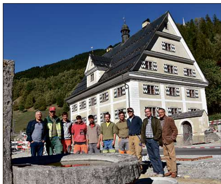
Igl onn proxim dispona la Cuort Ligia Grischa d'in niev curtgin. Las davosas duas jamnas han emprendists da miradur sanau il mir da crappa naturala circumdant.