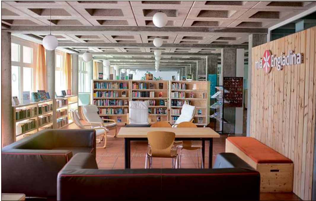
D'incuort ha pudü gnir inaugurada a l'IOF la nouva «cuntrada» d'imprender.