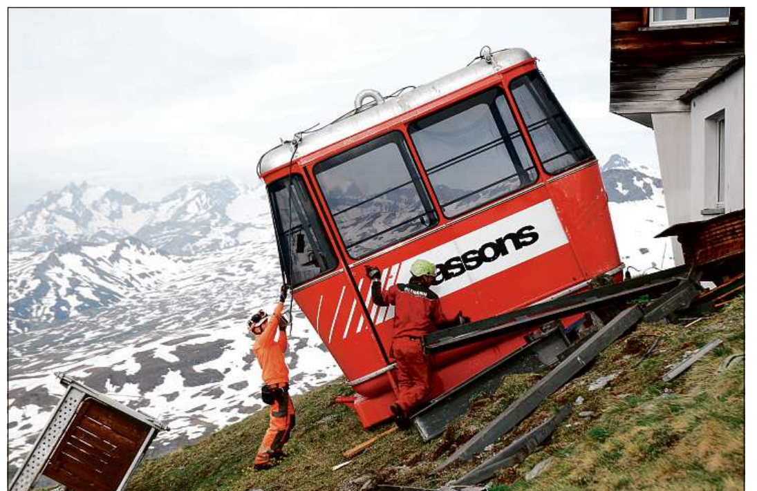
La cabina da Cassons ei historia, l'uniuin Pro Flem Cassons denton aunc buc.